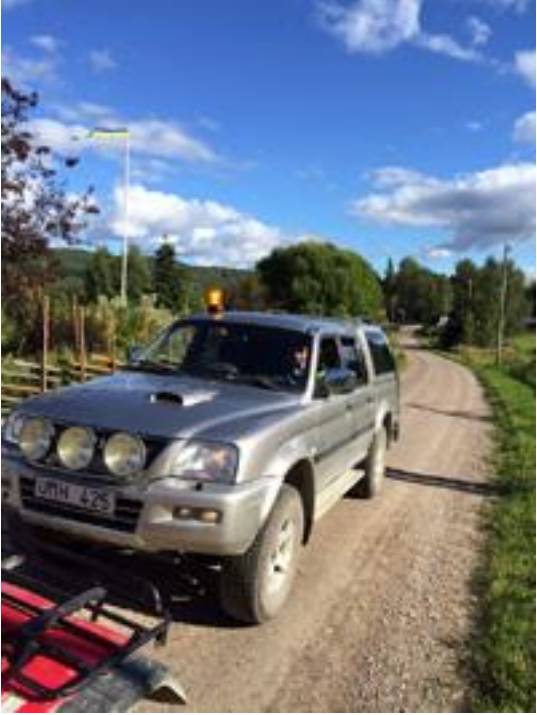
Bilder från dikning Sörviggevägen 2015-09-03 till 2015-09-04